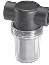
聚碳酸酯杯和聚丙烯滤头，10巴 1/2英寸-3/4英寸NPT或BSPT(内)