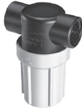
聚丙烯滤杯和滤头，10巴 1/2英寸-3/4英寸NPT或BSPT(内)